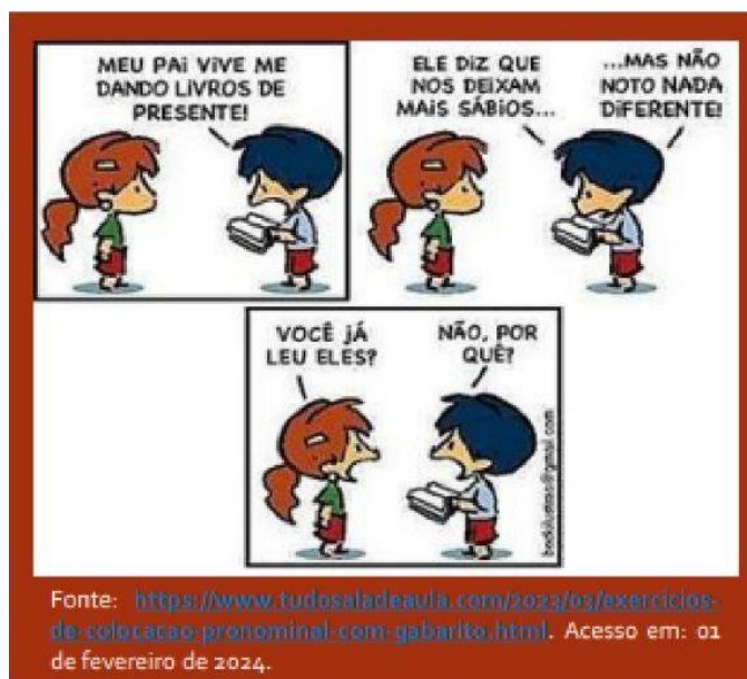
Figura 02: Atividade de leitura do gênero tirinha