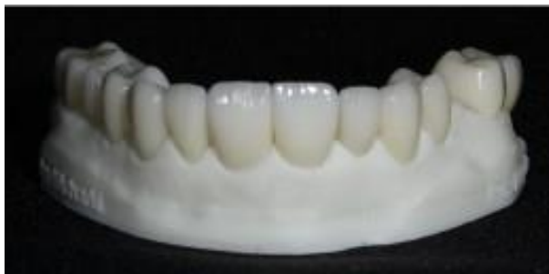
Imagem 6 - Peças cerâmicas do arco superior sobre o modelo de trabalho.

Optou-se por realizar a prova das peças impressas em resina fotossensível impressa antes das peças finais em cerâmica. A peça em resina foi posicionada sobre o preparo e, em seguida, inspecionada quanto à adaptação marginal, contorno vestibular e proximal, ponto de contato interproximal, perfil de emergência e espessura oclusal. Com base nessa etapa, as peças em vitrocerâmica de dissilicato de lítio cor A1 (Escala Vita Classical) (e-max, Ivoclar Vivadent, Schaan, Liechtenstein), conforme a tomada de cor, foram confeccionadas por meio de fresagem do bloco cerâmico em uma fresadora laboratorial (Imagem 6).