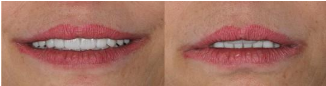
Imagem 10 - Aspecto final do sorriso. Exposição incisal quando o lábio superior em posição de repouso, proporcionando aspecto de jovialidade a paciente.

Imagem 9 - Aspecto final do arco superior, do arco inferior e da relação oclusal entre os arcos.