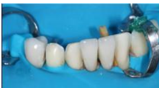
Imagem 7 - Cimentação adesiva das peças cerâmicas do arco inferior sobre isolamento absoluto do campo operatório.

Na sessão de cimentação adesiva, foi realizada cuidadosamente a inspeção da adaptação das peças no troquel e modelo de trabalho impresso, verificando o eixo de inserção e espessura de cada peça. A prova seca das peças foi realizada sobre os preparos em boca, avaliando os itens previamente mencionados. Sob isolamento absoluto, as peças foram cimentadas após o tratamento de superfície recomendado para o material restaurador dissilicato de lítio (condicionamento com ácido fluorídrico 10% por 20 segundos, seguido de lavagem abundante, aplicação de silano e secagem por 60 segundos). As coroas totais foram cimentadas com cimento resinoso dual autoadesivo (Panavia SA Luting, Kuraray, Osaka, Japão), enquanto as facetas e a V-onlay foram cimentadas com cimento resinoso fotopolimerizável (Variolink, Ivoclar Vivadent, Schaan, Liechtenstein), seguindo o protocolo de preparo prévio da peça e do dente (condicionamento ácido de 20 segundos em esmalte e 10 segundos na dentina, seguido da aplicação do adesivo dual Excite F DSC, Ivoclar Vivadent, Schaan, Liechtenstein). A remoção dos excessos de cimento foi realizada com auxílio de instrumentos manuais, e o polimento da interface de cimentação foi feito com tiras abrasivas, discos e borrachas abrasivas (Imagem 7).