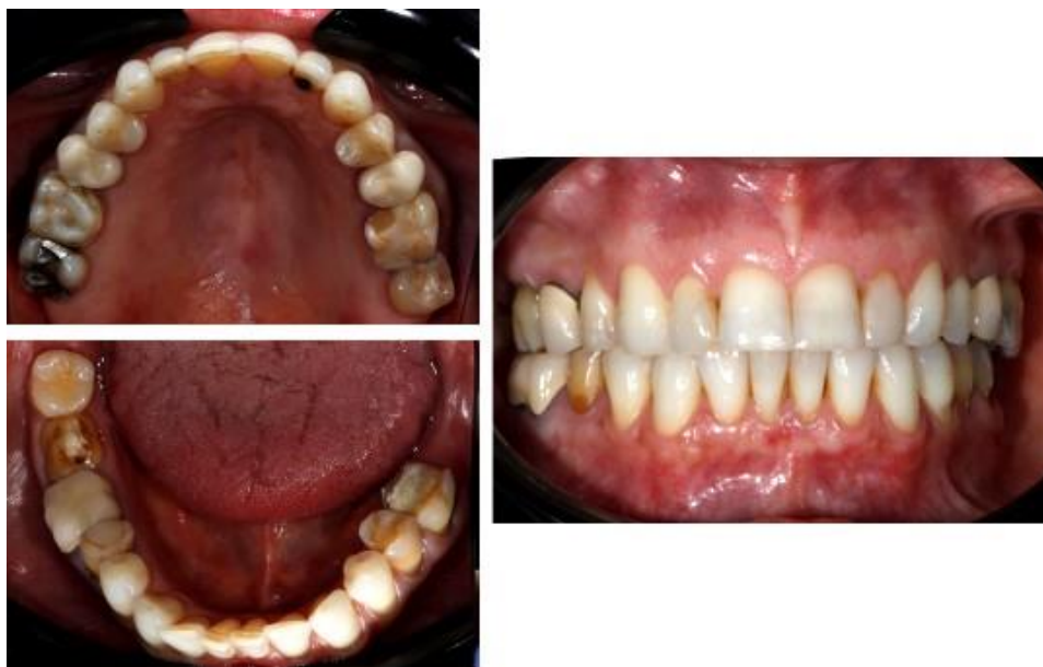
Imagem 1 - Aspecto inicial do arco superior, inferior e relação oclusal entre os arcos.

Na análise facial e nas fotografias extraorais (Imagens 2 e 3), foram observadas alterações estéticas e funcionais, incluindo desgaste dental no arco superior. Os dentes ântero-superiores apresentavam-se nivelados devido a esse desgaste, e, em posição de repouso, o lábio superior cobria completamente as bordas incisais, sem a exposição de aproximadamente 2 mm de estrutura dentária, conforme preconizado. Além disso, os dentes posteriores exibiam leves extrusões, o que, em conjunto, resultava em modificações nos planos incisal e oclusal, afetando a harmonia da curva de Spee.