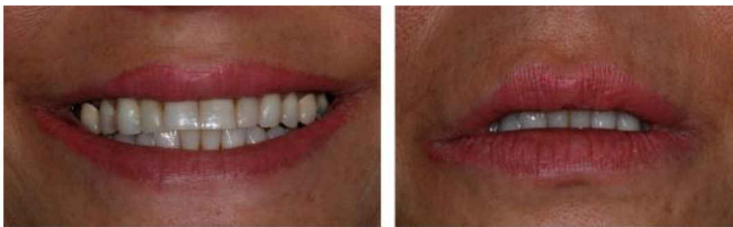
Imagem 3 - Aspecto inicial do sorriso. Ausência de exposição incisal quando o lábio superior em posição de repouso.

Para garantir a harmonia estética e funcional, foi realizada uma análise detalhada dos parâmetros faciais, como a proporção dos terços faciais, o alinhamento da linha interpupilar e da linha mediana, e a relação dos dentes com os planos incisal e oclusal. Esses achados ressaltam a importância de restabelecer a dimensão vertical de oclusão (DVO), o plano oclusal e as guias de desocclusão para alcançar um equilíbrio adequado no tratamento.