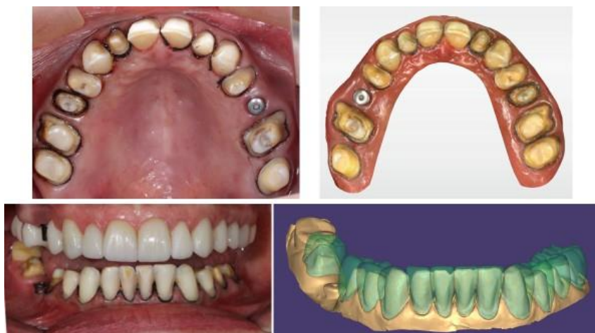
Imagem 5 - Preparos dentais dos arcos superior e inferior com fio afastador gengival e arquivo digital do escaneamento intraoral do arco superior. Projeto virtual das futuras restaurações cerâmicas do arco inferior, onde é possível observar a relação da futura restauração com o preparo protético por transparência.